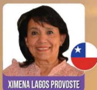
XIMENA LAGOS PROVOSTE